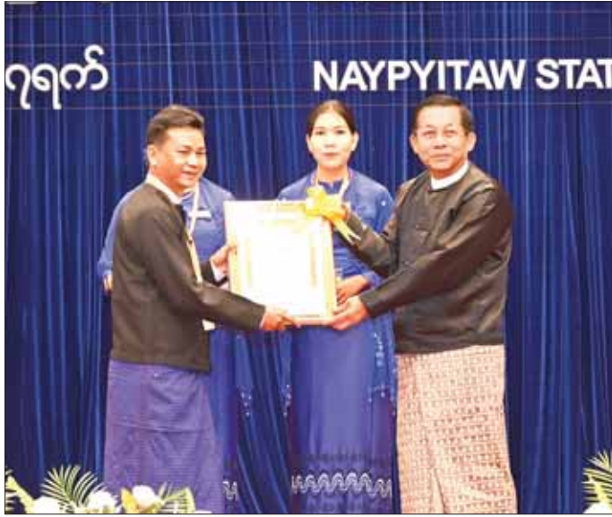
နိုင်ငံတော်စီမံအုပ်ချုပ်ရေးကောင်စီဥက္ကဋ္ဌ နိုင်ငံတော်ဝန်ကြီးချုပ် ဗိုလ်ချုပ်မှူးကြီး မင်းအောင်လှိုင် (၁၇)ကြိမ်မြောက် မြန်မာနိုင်ငံ ဝိဇ္ဇာနှင့်သိပ္ပံပညာရှင်အဖွဲ့ ဆုရရှိသူတစ်ဦးကို ဆုပေးအပ်ချီးမြှင့်စဉ်။