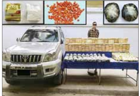
စိုင်းဆွေဆိုင်အား သိမ်းဆည်းရမိသည့် မူးယစ်ဆေးဝါးများနှင့်အတူ တွေ့ရစဉ်။