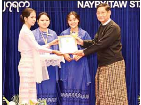
နိုင်ငံတော်စီမံအုပ်ချုပ်ရေးကောင်စီအဖွဲ့ဝင် ဒေါက်တာဘရွှေ ဆုရရှိသည့် စာတမ်းရှင် တစ်ဦးကို ဆုပေးအပ်ချီးမြှင့်စဉ်။