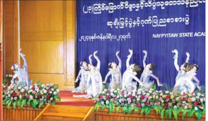
နိုင်ငံတော်စီမံအုပ်ချုပ်ရေးကောင်စီဥက္ကဋ္ဌ နိုင်ငံတော်ဝန်ကြီးချုပ် ဗိုလ်ချုပ်မှူးကြီး မင်းအောင်လှိုင်၊ ဇနီး ဒေါ်ကြူကြူလှနှင့် အဖွဲ့ဝင်များ သာသနာရေးနှင့်ယဉ်ကျေးမှုဝန်ကြီးဌာန အနုပညာဦးစီးဌာနမှ အနုပညာရှင်များ၏ တေးသံသာများ၊ အကအလှများဖြင့် သီဆိုတီးမှုတ်ကပြပျော်ဖြေမှုကို ကြည့်ရှုအားပေးကြစဉ်။