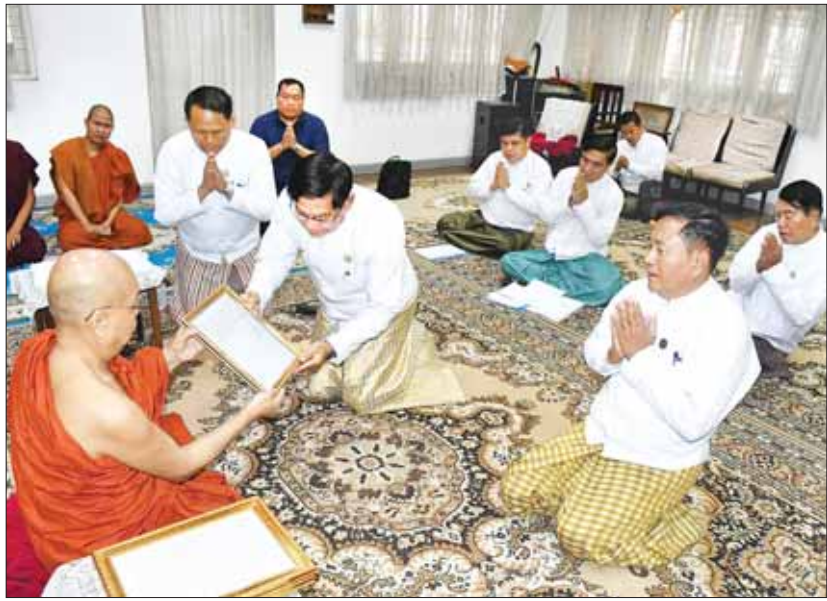
တိပိဋကဓရ တိပိဋကကောဝိဒ ရွေးချယ်ရေးစာမေးပွဲတွင် တိပိဋကဓရ တိပိဋကကောဝိဒ (၁၆) ပါးမြောက် ဘွဲ့တံဆိပ်တော် မြတ်ရရှိတော်မူသည့်ဆရာတော်ထံသို့ ပြည်ထောင်စုသမ္မတမြန်မာနိုင်ငံတော် နိုင်ငံတော်စီမံအုပ်ချုပ်ရေးကောင်စီ ဥက္ကဋ္ဌ နိုင်ငံတော်ဝန်ကြီးချုပ် ဗိုလ်ချုပ်မှူးကြီး သတိုးမဟာသရေစည်သူ သတိုးသီရိသုဓမ္မ မင်းအောင်လှိုင်ထံမှ ဆက်ကပ်ပေးပို့သည့် ဂုဏ်ယူဝမ်းမြောက်ကြောင်း သတင်းလွှာကို ဆရာတော်ထံ တိုင်းဒေသကြီးဝန်ကြီးချုပ် ဦးစိုးသိန်းက ဆက်ကပ်စဉ်။

ဖတ်ကြားလျှောက်ထား ဘွဲ့တံဆိပ်တော်ရ ဆရာတော်ဘဒ္ဒန္တ ရှေးဦးစွာအခမ်းအနားအား ရန်ကုန် ပညာသီရိလင်္ကာရအား ဂုဏ်ယူ တိုင်းဒေသကြီးဝန်ကြီးချုပ် ဦးစိုးသိန်း၊ ဝမ်းမြောက်ကြောင်း သတင်းလွှာကို သာသနာရေးနှင့် ယဉ်ကျေးမှုဝန်ကြီးဌာန ဆရာတော်ထံ ဆက်ကပ်သည်။ ဒုတိယဝန်ကြီး ဦးအေးထွန်း၊ တိုင်းဒေသ အလှူတော်ငွေများ ဆက်ကပ်လှူဒါန်း ကြီးအစိုးရအဖွဲ့ဝင် ဝန်ကြီးများက နမော ဆက်လက်၍ တိုင်းဒေသကြီး တာသသုံးကြိမ်ရွတ်ဆို ဘုရားကန်တော့ ဝန်ကြီးချုပ်၊ ဒုတိယဝန်ကြီးနှင့် တိုင်း ဤ ဖွင့်လှစ်ပြီး ရန်ကုန်တိုင်းဒေသကြီး ဒေသကြီးအစိုးရအဖွဲ့ဝင် ဝန်ကြီးများက ဝန်ကြီးချုပ် ဦးစိုးသိန်းက နိုင်ငံတော်စီမံ ဆရာတော်အား လှူဖွယ်ပစ္စည်းများနှင့် အုပ်ချုပ်ရေးကောင်စီဥက္ကဋ္ဌ နိုင်ငံတော် နာကမ္မအလှူတော်ငွေများ ဆက်ကပ် လှူဒါန်းကြသည်။ ဝန်ကြီးချုပ် ဗိုလ်ချုပ်မှူးကြီး သတိုးမဟာ သရေစည်သူ သတိုးသီရိသုဓမ္မ ယင်းနောက် ဆရာတော်က သဗ္ဗိ မင်းအောင်လှိုင်ထံမှ ဆက်ကပ်ပေးပို့သည့် တိယောဝိဝဇ္ဇန္တု အစရှိသော ဂါထာတော် ဂုဏ်ယူဝမ်းမြောက်ကြောင်း သတင်းလွှာ အား ဖတ်ကြားလျှောက်ထားသည်။ အားစူးအနားအား ဗုဒ္ဓသာသနာ့ စိရိတိဋ္ဌတု သုံးကြိမ်ရွတ်ဆိုဆုတောင်း၍ အောင်မြင်စွာ ပြီးဆုံးခဲ့ကြောင်း သိရသည်။ သတင်းစဉ်