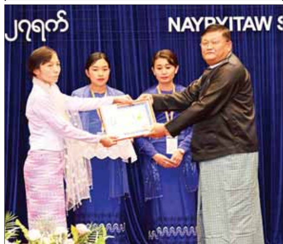
နိုင်ငံတော်စီမံအုပ်ချုပ်ရေးကောင်စီအဖွဲ့ဝင် ဦးရန်ကျော် ဆုရရှိသည့် စာတမ်းရှင်တစ်ဦးကို ဆုပေးအပ်ချီးမြှင့်စဉ်။