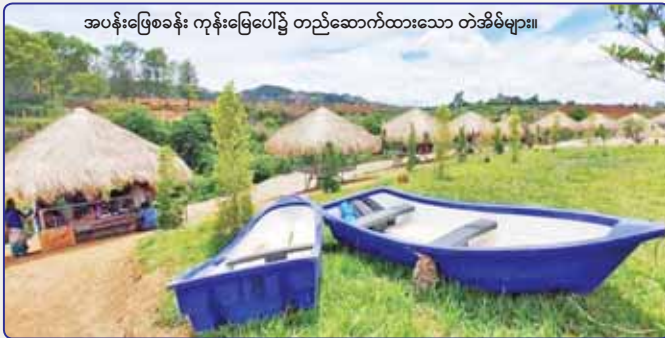
အပန်းဖြေစခန်း ကုန်းမြေပေါ်၌ တည်ဆောက်ထားသော တံအိမ်များ။

အတိုင်းသွားပြီး ကလေးအထွက် ပင်လောင်း- လျှိုင်ကော်လမ်းမအတိုင်း သွားရောက်နိုင်ပါတယ်။ စာရေးသူကတော့ ကလေးကနေ ဆိုင်ကယ်နဲ့ သွားတာဖြစ်ပြီး မိနစ် ၃၀ ကျော်လောက် မောင်းရ ပါတယ်။ ကားနဲ့သွားရင်တော့ ပိုပြီးအချိန်ကုန် သက်သာနိုင်ပါတယ်။ မြင်းမထိရွာကိုကျော်ပြီး ပင်လောင်းမြို့အဝင် ဆိုင်းဘုတ်ရောက်ခါနီး တံတား