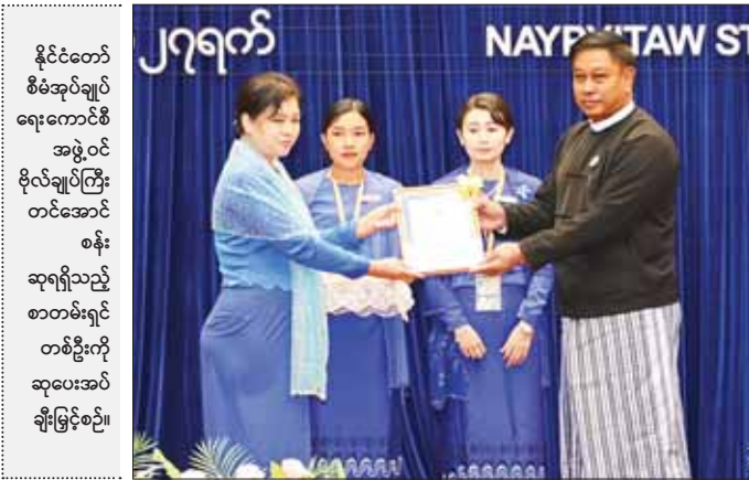
နိုင်ငံတော် စီမံအုပ်ချုပ်ရေးကောင်စီ အဖွဲ့ဝင် ဗိုလ်ချုပ်ကြီး တင်အောင်စန်း ဆုရရှိသည့် စာတမ်းရှင် တစ်ဦးကို ဆုပေးအပ်ချီးမြှင့်စဉ်။