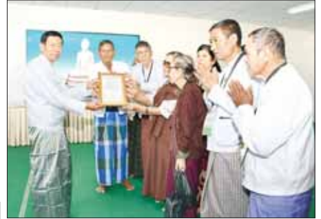
ပဲခူးတိုင်းဒေသကြီးမှ အငြိမ်းစားနိုင်ငံဝန်ထမ်းများ မာရဝိဇယဘုရားတော်မြတ်ကြီးအား ဖူးမြော်ကြည့်ရုံ အလှူငွေပေးအပ်လှူဒါန်းစဉ်။