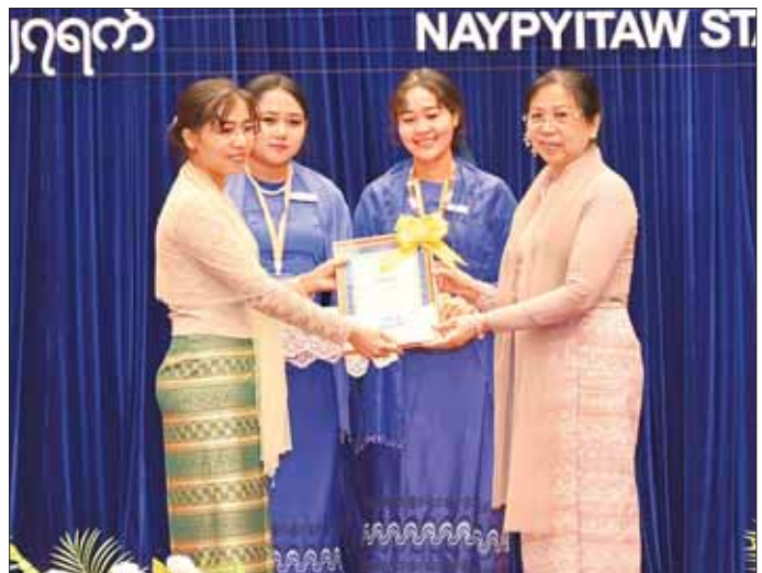
နိုင်ငံတော်စီမံအုပ်ချုပ်ရေးကောင်စီဥက္ကဋ္ဌ နိုင်ငံတော်ဝန်ကြီးချုပ် ဗိုလ်ချုပ်မှူးကြီး မင်းအောင်လှိုင်၏ဇနီး ဒေါ်ကြူကြူလှ မြန်မာဘာသာရပ်နှင့် အင်္ဂလိပ်ဘာသာရပ်တို့တွင် အကောင်းဆုံးစာတမ်းဆု ရရှိသူတစ်ဦးကို ဆုပေးအပ်ချီးမြှင့်စဉ်။