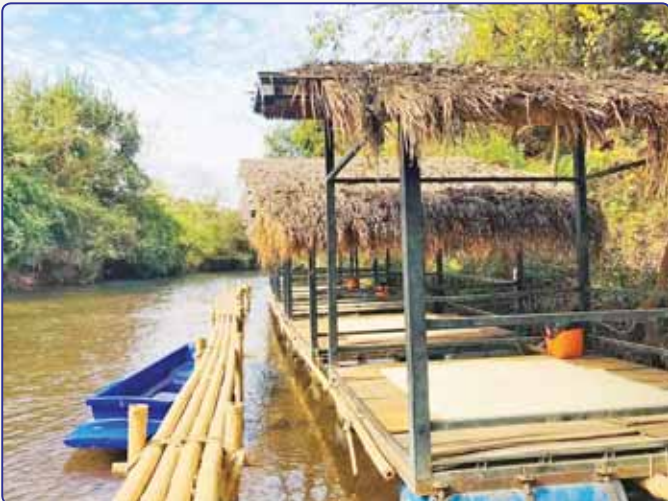
ဘီလူးချောင်းရေပြင်အတွင်း ဖောင်သဖွယ်ဆောက်လုပ်ထားသော ရေပေါ်တံအိမ်ငယ်များ။