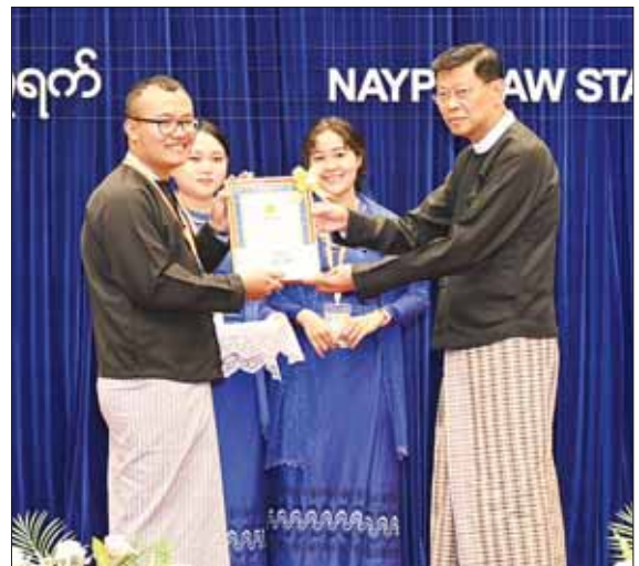
နိုင်ငံတော်စီမံအုပ်ချုပ်ရေးကောင်စီ အဖွဲ့ဝင် ဗိုလ်ချုပ်ကြီး မြထွန်းဦး ဆုရရှိသည့် စာတမ်းရှင်တစ်ဦးကို ဆုပေးအပ်ချီးမြှင့်စဉ်။