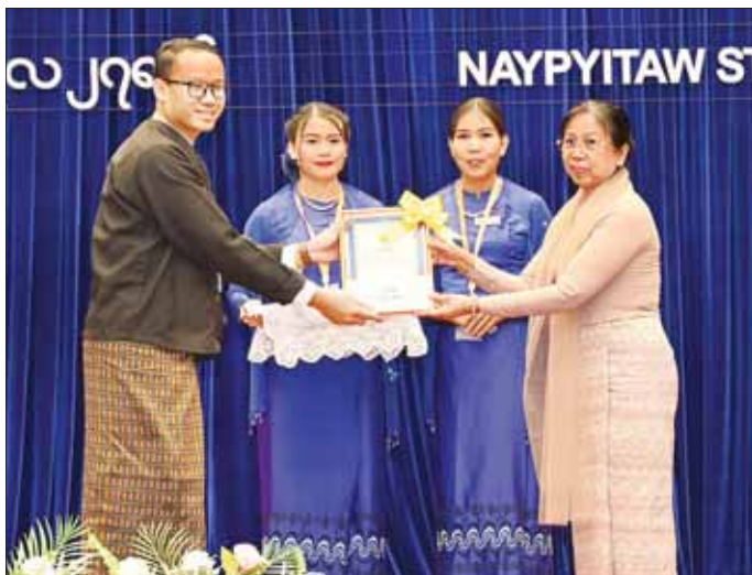
နိုင်ငံတော်စီမံအုပ်ချုပ်ရေးကောင်စီဥက္ကဋ္ဌ နိုင်ငံတော်ဝန်ကြီးချုပ် ဗိုလ်ချုပ်မှူးကြီး မင်းအောင်လှိုင်၏ဇနီး ဒေါ်ကြူကြူလှ မြန်မာဘာသာရပ်နှင့် အင်္ဂလိပ်ဘာသာရပ်တို့တွင် အကောင်းဆုံးစာတမ်းဆု ရရှိသူတစ်ဦးကို ဆုပေးအပ်ချီးမြှင့်စဉ်။