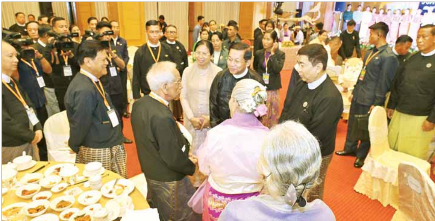
နိုင်ငံတော်စီမံအုပ်ချုပ်ရေးကောင်စီဥက္ကဋ္ဌ နိုင်ငံတော်ဝန်ကြီးချုပ် ဗိုလ်ချုပ်မှူးကြီး မင်းအောင်လှိုင်နှင့် ဇနီး ဒေါ်ကြူကြူလှတို့ ဝါရင့်ပညာရှင်ကြီးများနှင့် တက်ရောက်လာကြသူများကို ရင်းရင်းနှီးနှီးနှုတ်ဆက်စဉ်။