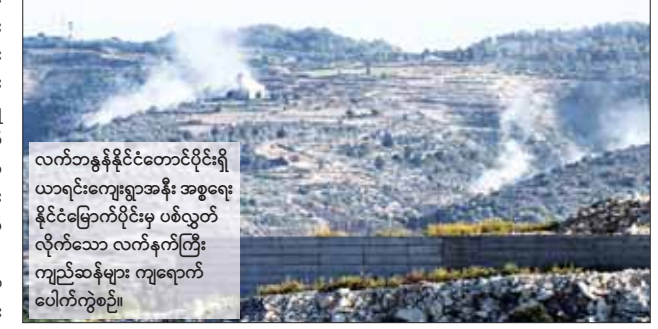
လက်ဘနွန်နိုင်ငံတောင်ပိုင်းရှိ ယာရင်းကျေးရွာအနီး အစွဲရောင် နိုင်ငံခြောက်ပိုင်းမှ ပစ်လွှတ် လိုက်သော လက်နက်ကြီး ကျည်ဆန်များ ကျရောက် ပေါက်ကွဲစဉ်။

ကို Falaq-1 ခုံးကျည်များဖြင့် ပထမဆုံး အကြိမ် ပစ်ခတ်တိုက်ခိုက်ခဲ့ကြောင်း ပြောသည်။ ဟားမားစ်အဖွဲ့က အစွဲရောင်ကို တိုက်ခိုက်မှုအား ထောက်ခံသည့်အနေဖြင့် ဟစ်ဇ်ဘိုလာအဖွဲ့က အစွဲရောင်ကို ခုံးကျည်ဒါဇင်နှင့်ချီ ပစ်ခတ်ပြီးနောက် လက်ဘနွန်-အစွဲရောင် နယ်စပ်တစ်လျှောက် တင်းမာမှုများ မြင့်တက်လျက်ရှိသည်။