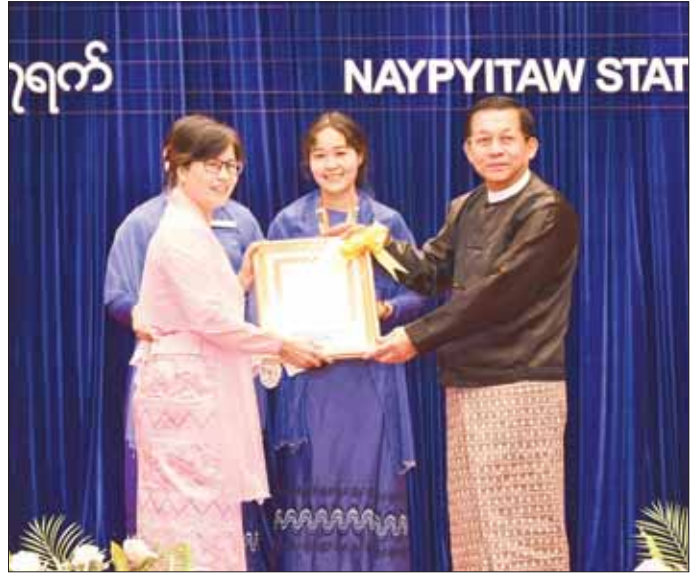
နိုင်ငံတော်စီမံအုပ်ချုပ်ရေးကောင်စီဥက္ကဋ္ဌ နိုင်ငံတော်ဝန်ကြီးချုပ် ဗိုလ်ချုပ်မှူးကြီး မင်းအောင်လှိုင် (၁၇)ကြိမ်မြောက် မြန်မာနိုင်ငံ ဝိဇ္ဇာနှင့်သိပ္ပံပညာရှင်အဖွဲ့ ဆုရရှိသူတစ်ဦးကို ဆုပေးအပ်ချီးမြှင့်စဉ်။