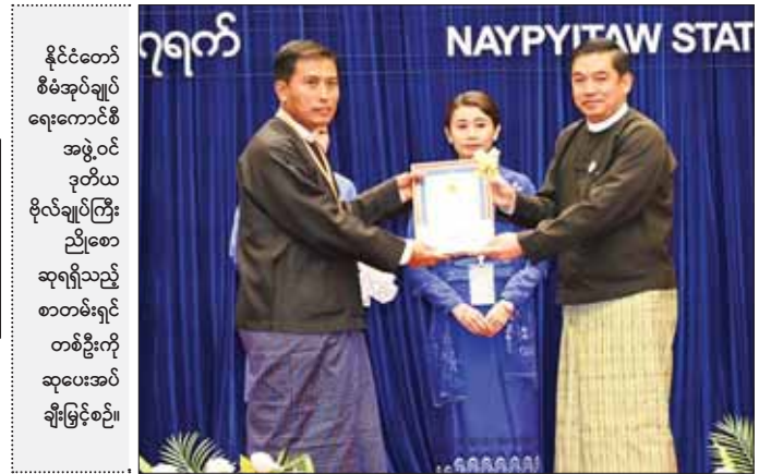
နိုင်ငံတော် စီမံအုပ်ချုပ်ရေးကောင်စီ အဖွဲ့ဝင် ဒုတိယ ဗိုလ်ချုပ်ကြီး ညိုစော ဆုရရှိသည့် စာတမ်းရှင် တစ်ဦးကို ဆုပေးအပ်ချီးမြှင့်စဉ်။