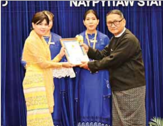
နိုင်ငံတော်စီမံအုပ်ချုပ်ရေးကောင်စီအဖွဲ့ဝင် ဒေါက်တာမူဝန် ဆုရရှိသည့် စာတမ်းရှင် တစ်ဦးကို ဆုပေးအပ်ချီးမြှင့်စဉ်။

စာမျက်နှာ ၄ မှ ဒေါက်တာအေးစုငြိမ်း၊ ဦးခင်အေးနှင့် ဒေါ်ကေခိုင်ငြိမ်းတို့ကိုလည်းကောင်း ဆုများ ပေးအပ်ချီးမြှင့်သည်။ ဆုများပေးအပ်ချီးမြှင့် ထို့နောက် ကောင်စီတွဲဖက်အတွင်းရေးမှူး ဒုတိယဗိုလ်ချုပ်ကြီး ရဲဝင်းဦး၊ ကောင်စီဝင်များ ဖြစ်ကြသည့် ဗိုလ်ချုပ်ကြီး မြထွန်းဦး၊ ဗိုလ်ချုပ်ကြီး တင်အောင်စန်း၊ ဒုတိယဗိုလ်ချုပ်ကြီး ညိုစော၊ ပိုးရယ်အောင်သိန်း၊ မန်းငြိမ်းမောင်၊ ဒေါက်တာမူဝန်၊ ဒေါက်တာ ဘရွှေနှင့် ဦးရန်ကျော်၊ ကာကွယ်ရေးဦးစီးချုပ် (ရေ) ဒုတိယဗိုလ်ချုပ်ကြီး ဇွဲဝင်းမြင့်၊ စာမျက်နှာ ၆ သို့