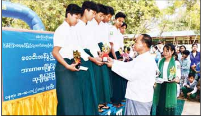
တာဝန်ရှိသူများသည် ဗလင်းတန်ဖွံ့ဖြိုးရေး လူငယ် ပွဲတော်တွင် ခင်းကျင်းပြသထားသည့် ဌာနဆိုင်ရာ ပြခန်းများနှင့် အားကစားပြိုင်ပွဲများတွင် ကျောင်းသား ကျောင်းသူများ ပါဝင်ယှဉ်ပြိုင်နေမှု များကို ကြည့်ရှုအားပေးကာ ဆုရရှိကြသော ကျောင်းသား ကျောင်းသူများအား ဆုများပေးအပ်ခဲ့ ကြောင်း သိရသည်။ ခရိုင်(ပြန်/ဆက်)

ခြင်းနှင့်စပ်လျဉ်း၍ အမှာစကား ပြောကြားသည်။ ဆက်လက်ပြီး တိုင်းဒေသကြီး ဝန်ကြီးချုပ်နှင့် တာဝန်ရှိသူများက ဗလင်းတန်ဖွံ့ဖြိုးရေး အထက် တန်း၊ အလယ်တန်း၊ မူလတန်းအဆင့် စာစီစာကုံး၊ ကဗျာရွတ်၊ ပုံပြင်ပြော၊ ဆေးရောင်ခြယ်ပြိုင်ပွဲများ၌ ဆုရရှိကြသော ကျောင်းသား ကျောင်းသူများအား ဆုများပေးအပ်သည်။ ထို့နောက် တိုင်းဒေသကြီး ဝန်ကြီးချုပ်နှင့်ဝင် များသည့် အမှတ်(၂) အခြေခံပညာအထက်တန်း ကျောင်း(အလုံ)မှ ကျောင်းသား ကျောင်းသူများ၏ တေးသီချင်းများဖြင့် သီဆိုကပြဖျော်ဖြေမှုကို ကြည့်ရှု အားပေးကာ တိုင်းဒေသကြီး လူမှုရေးရာဝန်ကြီး ဦးဝင်းမြတ်စိုးက တိုင်းဒေသကြီး ပြန်ကြားရေးနှင့် ပြည်သူ့ဆက်ဆံရေးဦးစီးဌာန တိုင်းဒေသကြီး ဦးစီးမှူးထံ ထောက်ပံ့ငွေများ ပေးအပ်သည်။ ထို့နောက် တိုင်းဒေသကြီး ဝန်ကြီးချုပ်နှင့်