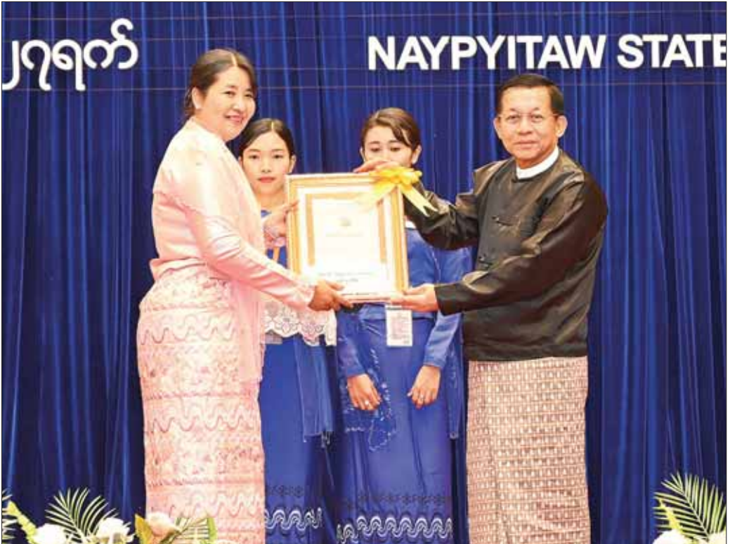
နိုင်ငံတော်စီမံအုပ်ချုပ်ရေးကောင်စီဥက္ကဋ္ဌ နိုင်ငံတော် ဝန်ကြီးချုပ် ဗိုလ်ချုပ်မှူးကြီး မင်းအောင်လှိုင် (၁၇) ကြိမ်မြောက် မြန်မာနိုင်ငံ ဝိဇ္ဇာနှင့်သိပ္ပံပညာရှင် အဖွဲ့ ဆုရရှိသူတစ်ဦးကို ဆုပေးအပ်ချီးမြှင့်စဉ်။

နေပြည်တော် ဇန်နဝါရီ ၂၇ ပညာရေးဝန်ကြီးဌာန၊ (၂၃) ကြိမ်မြောက် ဝိဇ္ဇာ နှင့် သိပ္ပံသုတေသနညီလာခံ ဆုချီးမြှင့်ပွဲနှင့် ဂုဏ်ပြု ညစာစားပွဲအခမ်းအနားကို ယနေ့ညပိုင်းတွင်နေပြည် တော်ရှိ Naypyitaw State Academy ၌ ကျင်းပ ပြုလုပ်ရာ နိုင်ငံတော်စီမံအုပ်ချုပ်ရေးကောင်စီဥက္ကဋ္ဌ နိုင်ငံတော်ဝန်ကြီးချုပ် ဗိုလ်ချုပ်မှူးကြီး မင်းအောင် လှိုင်နှင့်ဇနီး ဒေါ်ကြူကြူလှတို့ တက်ရောက်ချီးမြှင့် သည်။ အခမ်းအနားသို့ နိုင်ငံတော်စီမံအုပ်ချုပ်ရေး ကောင်စီဥက္ကဋ္ဌ နိုင်ငံတော်ဝန်ကြီးချုပ်နှင့် ဇနီးတို့ နှင့်အတူ ကောင်စီတွဲဖက်အတွင်းရေးမှူး ဒုတိယ ဗိုလ်ချုပ်ကြီး ရဲဝင်းဦးနှင့်ဇနီး၊ ကောင်စီအဖွဲ့ဝင်များ နှင့် ဇနီးများ၊ ပြည်ထောင်စုအဆင့်ပုဂ္ဂိုလ်များ၊ ပြည်ထောင်စုဝန်ကြီးများနှင့်ဇနီးများ၊ နေပြည်တော် ကောင်စီဥက္ကဋ္ဌ အဆင့်မြင့်တပ်မတော်အရာရှိကြီး များ၊ နေပြည်တော်တိုင်းစစ်ဌာနချုပ်တိုင်းမှူး၊ ဒုတိယ ဝန်ကြီးများ၊ ပါမောက္ခချုပ်များ၊ ပါမောက္ခများ၊ မြန်မာနိုင်ငံဝိဇ္ဇာနှင့် သိပ္ပံပညာရှင်အဖွဲ့ဥက္ကဋ္ဌနှင့် အဖွဲ့ဝင်များ၊ စာတမ်းရှင်များနှင့် ဖိတ်ကြားထား သူများ တက်ရောက်ကြသည်။ စာမျက်နှာ ၄ ကော်လံ ၁ ◆