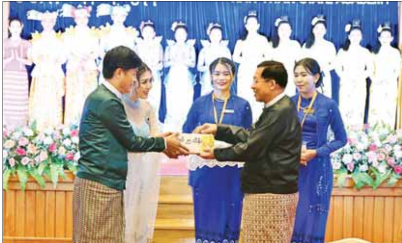
နိုင်ငံတော်စီမံအုပ်ချုပ်ရေးကောင်စီဥက္ကဋ္ဌ နိုင်ငံတော်ဝန်ကြီးချုပ် ဗိုလ်ချုပ်မှူးကြီး မင်းအောင်လှိုင် ဖျော်ဖြေတင်ဆက်ခဲ့ကြသည့် သာသနာရေးနှင့်ယဉ်ကျေးမှုဝန်ကြီးဌာန အနုပညာဦးစီးဌာနမှ အနုပညာရှင်များကို ချီးမြှင့်ငွေများ ပေးအပ်စဉ်။