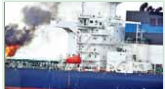
နိုင်ငံတကာသတင်း စာ ၁၃

အေဒင်ပင်လယ်ကွေ့ရှိ ဗြိတိန်ရေနံတင်သင်္ဘောကို ဟူသီအဖွဲ့ခွဲကျည်ဖြင့် တိုက်ခိုက်