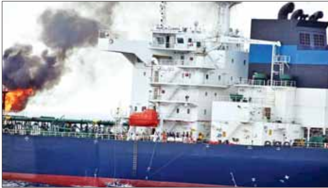
ဟူသီအုပ်စုက ခုံးကျည်ဖြင့်တိုက်ခိုက်ခဲ့သောကြောင့် ဗြိတိန်သင်္ဘော မီးလောင်နေမှုကို တွေ့ရစဉ်။

ဆာနား ဇန်နဝါရီ ၂၇ ယီမင်နိုင်ငံရှိ ဟူသီလက်နက်ကိုင်အဖွဲ့သည် အေဒင်ပင်လယ်ကွေ့၌ ဗြိတိန်ရေနံတင်သင်္ဘောကို ခုံးကျည် သစ်ဖြင့် တိုက်ခိုက်ခဲ့ကြောင်း ဇန်နဝါရီ ၂၆ ရက်က ပြောကြားသည်။